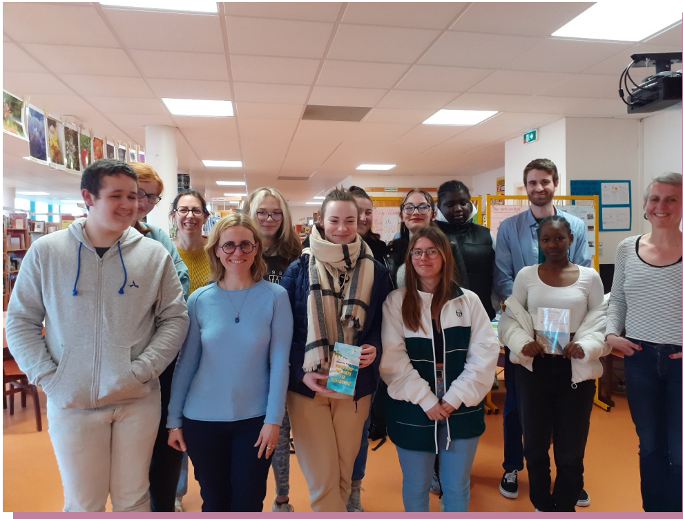
Au CDI avec l'auteur

Au-delà de son roman, nous avons découvert ses films et des séries dans notre quotidien. Il nous a conseillé d'écrire tout ce qui nous passe par la tête pour nous libérer de notre stress et nos colères. Mais aussi pour dire le positif, nos projets. Lui écrit depuis qu'il a 11 ans.