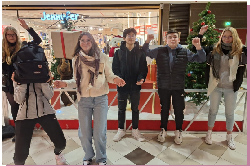
Joyeuses retrouvailles aux Eleïs à l'issue du rallye

Un des objectifs était que les deux classes apprennent à se connaître. Un autre objectif était de repérer les lieux faisant référence à l'Irlande dans Cherbourg.