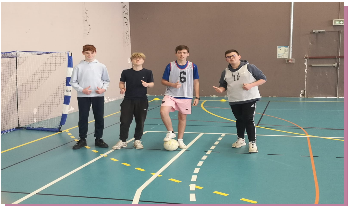
Une des équipes du jour.

Cette rencontre était évidemment lien avec le voyage en Irlande en octobre prochain et l'objectif est de nous revoir à l'automne prochain en terre irlandaise !