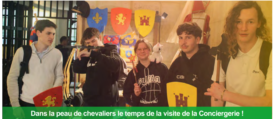
Dans la peau de chevaliers le temps de la visite de la Conciergerie !

Nous avons ensuite marché de nombreux kilomètres pour nous rendre à la Conciergerie. Nous sommes passés devant le palais du Luxembourg (siège du Sénat), la Sorbonne et avons pu apercevoir le Panthéon