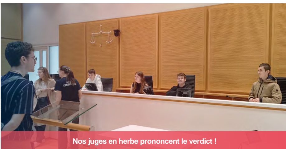
Nos juges en herbe prononcent le verdict !

Le bâtiment dispose d'une entrée principale par laquelle tout le monde passe (avocats, magistrats, visiteurs, etc.) sauf les prévenus qui entrent côté « Bastion ». Nous n'avons pas eu la chance d'assister à une audience car c'était les vacances judiciaires mais nous avons pu nous installer dans l'une des nombreuses salles d'audiences et s'apercevoir que sa configuration très plane place les accusés, le public et les juges sur le même pied d'égalité.