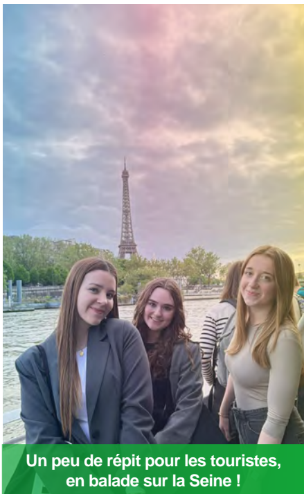
Un peu de répit pour les touristes, en balade sur la Seine !

Nous sommes tous entrés dans les magnifiques Galeries Lafayette situées boulevard Haussmann qui comptent 7 étages et environ 2 000 marques, principalement de luxe. Elles accueillent de nombreux visiteurs venus pour acheter ou bien seulement visiter. Tout en haut, depuis le rooftop , on peut boire un verre ou déjeuner en admirant la vue panoramique de Paris. On y voit la Tour Eiffel et l'Opéra Garnier. Nous avons trouvé les prix du restaurant assez excessifs (4€ le soda). Au dernier étage, il y a une salle de sport et un espace bien-être. Tous les autres étages sont destinés à mettre en valeur les différentes marques par les nombreux conseillers mis à notre disposition. Nous avons pu observer différentes stratégies marketing comme parfumer les visiteurs lors de leur passage. Nous avons identifié d'autres enseignes autour : Printemps et Citadium, par exemple.