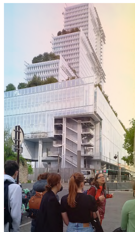
Vertigineux, le Tribunal de Paris !

Avant sa construction, la juridiction était installée sur l'Île de la Cité, visitée la veille. Autour du Tribunal, nous retrouvons d'autres bâtiments comme la Maison des avocats, les cellules des accusés et enfin le Tribunal de Police qui a été conçu pour ressembler au ciel afin de dissuader les attaques terroristes. Ce dernier est appelé « 36 » en clin d'œil au 36 quai des Orfèvres, adresse des anciens bureaux de la Direction régionale de la police judiciaire. L'architecture du tribunal a été pensée pour que le lieu soit accueillant et rassurant grâce aux couleurs intérieures : le blanc sur les murs et les escalators, associé au bois blond qui représente le « parquet » et au rouge tomate que l'on retrouve en petites touches toniques. De plus, l'architecte a supprimé les traditionnelles marches que l'on retrouve à l'entrée des Palais de Justice pour apporter un sentiment d'égalité.