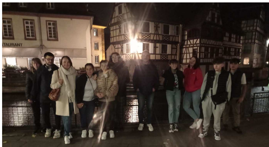
Quartier de la Petite France

Cette ville lumineuse avec différents types de moyens de transports ( tramway, bus, vélo, trottinette) est aérée avec de grands espaces et très calme. Beaucoup d'habitants se déplacent en vélo.