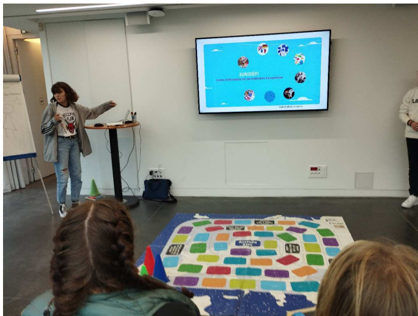
Dans la salle d'activités : le jeu de l'oie européen (Eurodéfi) avec les questions au tableau