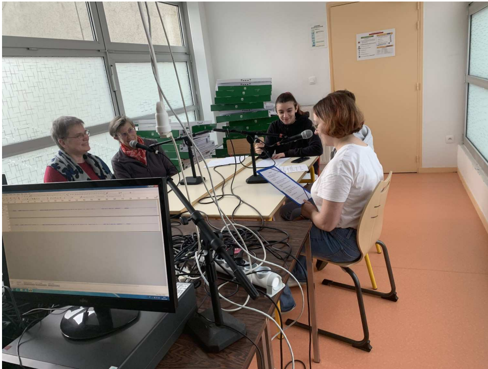
Les bénévoles de l'association en interview au studio radio du lycée le 16 novembre 2022.

Nous les avons interviewées dans le studio radio du lycée Tocqueville le 16 novembre 2022. Elles ont parlé de l'association, de leurs activités et de leur apprentissage de la dentelle.