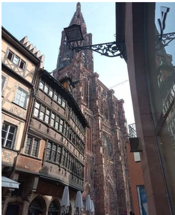
La cathédrale Notre Dame de Strasbourg du XIII e siècle

Nous sommes arrivés à la gare de Strasbourg le mardi 11 octobre 2022 en début d'après-midi et nous sommes rendus au pied d'une extraordinaire cathédrale. Nous avons fait une mini-croisière dans la ville sur la rivière Ill en bateau mouche . On a vu des maisons alsaciennes de différentes couleurs, des anciens moulins à eau, des écluses et le quartier de la Petite France. Nous sommes passés devant l'ancienne prison de Strasbourg puis avons débarqué devant le Parlement Européen et son quartier. Puis on est repassé devant la cathédrale Notre Dame de Strasbourg pour rentrer à notre auberge de jeunesse .