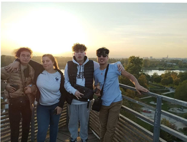
Au sommet de la tour Weißtannenturm ou tour des sapins blancs

Nous sommes aussi partis faire un tour dans le jardin des Deux Rives situé à la fois en France et en Allemagne relié par une passerelle qui nous menait à l'Auberge de jeunesse.