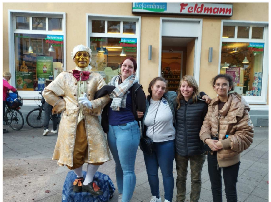
Rencontre avec un homme statue dans le centre ville de Kehl

Nous avons fait un petit tour dans le centre ville puis nous avons escaladé la tour Weißtannenturm qui mesure 44 mètres. En haut de la tour, nous avons admiré la vue panoramique sur Strasbourg, le Rhin et les montagnes.