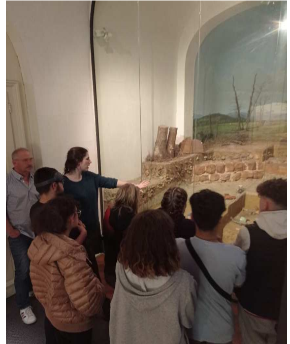
La guide nous explique le travail de l'archéologue

Après cette présentation la guide nous a expliqué les découvertes de l'époque gallo-romaine en Alsace.